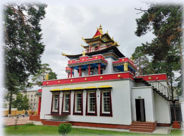
Читинский Дацан "Дамба Брайбунлинг"